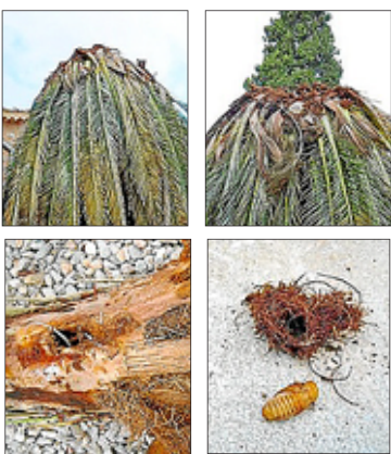
Els primers exemplars afectats.