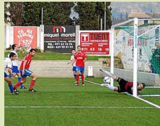
1-0.L'equip de Kike hagué de suar front l'Artà. » J.O.

Avui Teledeporte (12h.) emetrà en directe el partit Rivas-Sóller Bon dia!